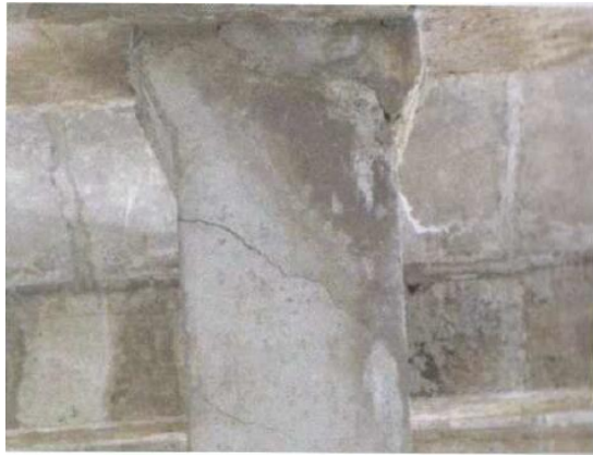
腹拱墩混凝土开裂

自“十二五”以来，黄山市在危桥改造项目共投入资金 1.09 亿元，改造三、四类桥 37 座，约 2200 延米。2014 年以来改造了 2 座双曲拱桥，均使用了加固主拱肋、拆除腹拱圈，更换腹拱为梁式结构的新型加固方案，完成了对桥梁的维修加固。