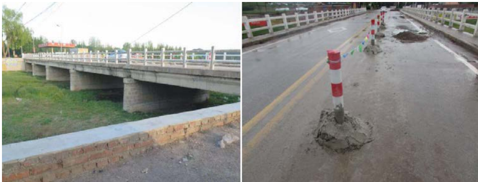
凌兴线六官营子中桥原桥

根据原桥梁结构病害情况，通过技术状况评定与计算分析，可以判断六官营子中桥原上部结构承载能力不足，存在较高安全隐患。