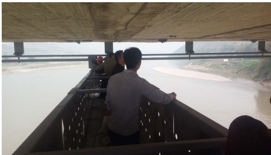
移动式永久性桥梁检修桁车

一是设计、施工及安装移动式永久性检修桁车。受斜拉索限制，桥检车桁架无法伸入主跨桥梁下部。为方便主桥桥梁常规检查和维修，及时消除安全隐患，自主设计在主桥箱梁下部施工安装移动式永久性桥梁检修桁车。