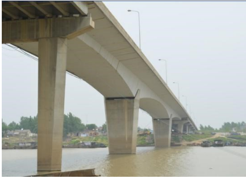
G105 南照淮河公路大桥主桥原貌