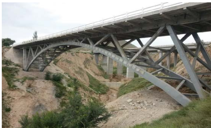
加固后桥梁正面图

定陇公路 3 号转体桥全长 101.2 米，是甘肃省定西至陇西公路上的重要桥梁，对定西和陇西两地经济发展起着至关重要的作用。2008 年以来，重型车辆急剧增加，致使该路线桥梁超负荷运营，导致沿线桥梁出现主要构件结构性破损，桥面板断裂、横梁、拱圈裂缝等病害。该桥处于典型的黄土地区、贫困地区，在地基承载力较低、车流量增速大等特定情况下，怎样经济合理、快速的完成桥梁加固，是该桥加固过程中最大的难题。