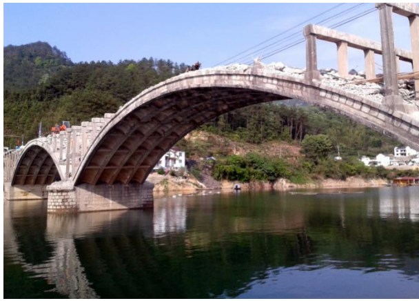
破除桥梁护栏、桥面铺装及腹拱